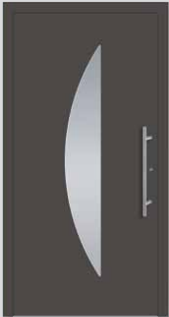
A 2011-7 Edelstahlrahmen innen Edelstahl-Griff G-1020