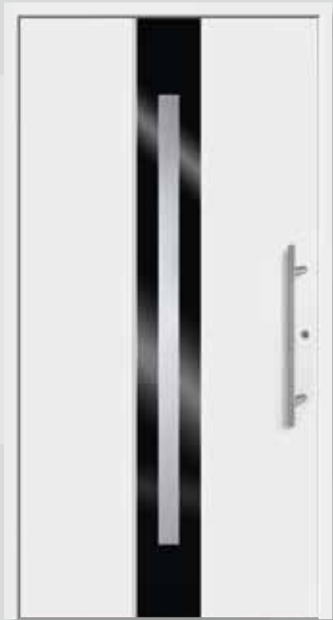
A 2011-5 Edelstahlrahmen innen Edelstahl-Griff G-1020