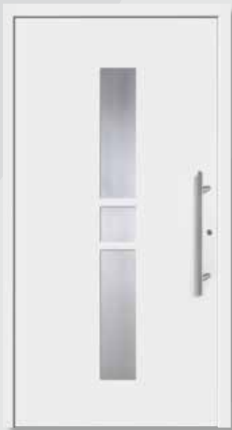
A 2011-6 Edelstahlrahmen innen Edelstahl-Griff G-1020