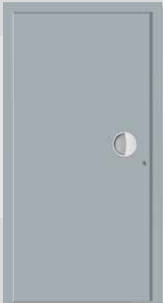
A 2011-1 geschlossene Füllungsplatte mit integrierter Griffmuschel