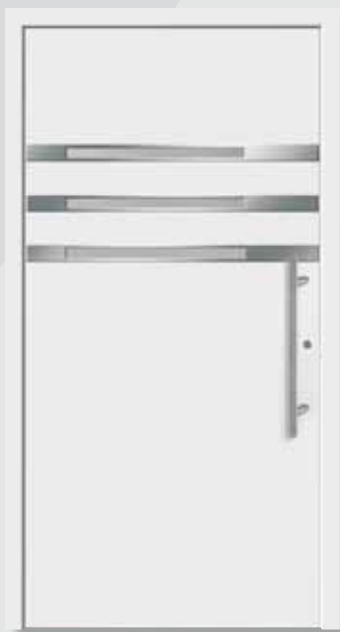
A 2011-2 Edelstahlapplikationen aussen, Edelstahlrahmen innen Edelstahl-Griff G-1020