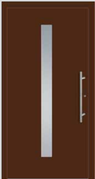
A 2011-8 ausßen rahmenlos, Edelstahlrahmen innen Edelstahl-Griff G-1020